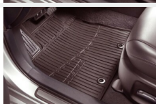
Dywaniki gumowe przednie Dywaniki / Wykładziny