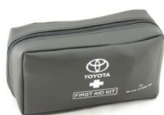
Apteczka DIN13164 APTECZKI/Bezpieczeństwo