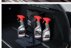
Zestaw kosmetyków samochodowych Toyota Kosmetyki