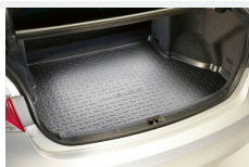
Wykładzina bagażnika gumowa Dywaniki / Wykładziny